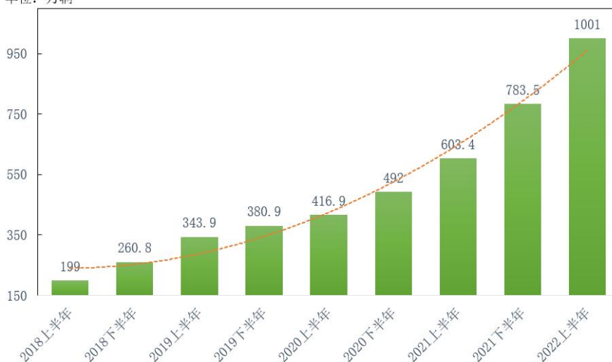
图 1. 2018-2022 年新能源汽车保有量半年变化情况

深入开展公共机构绿色低碳引领行动。2021 年，全国 28 个地区出台“十四五”公共机构节能专项规划，16 个地区制定本地区公共机构绿色低碳引领行动实施方案。公共机构单位建筑面积能耗、人均综合能耗和人均用水量 2021 年同比下降 1.14%、1.32% 和 1.30%。截至 2021 年 6 月，全国约 35% 县级及以上党政机关建成节约型机关，中央和国家机关本级全部建成节约型机关，创建节约型公共机构示范单位 5114 家、遴选公共机构能